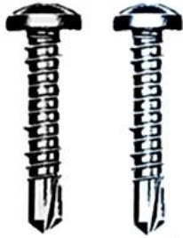
ステンレス ユニクロメッキコーティング