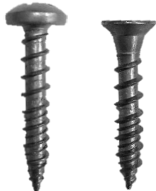
ステンレスコーティング